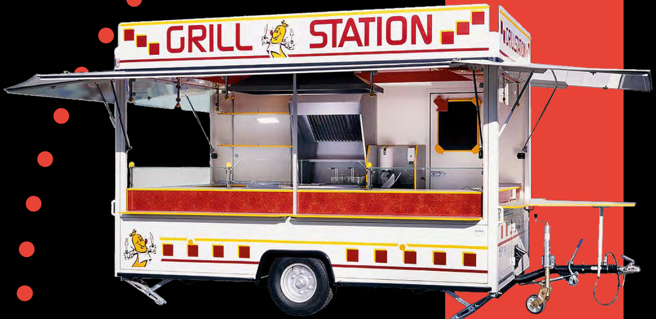
(Abbildung mit Sonderausstattung)